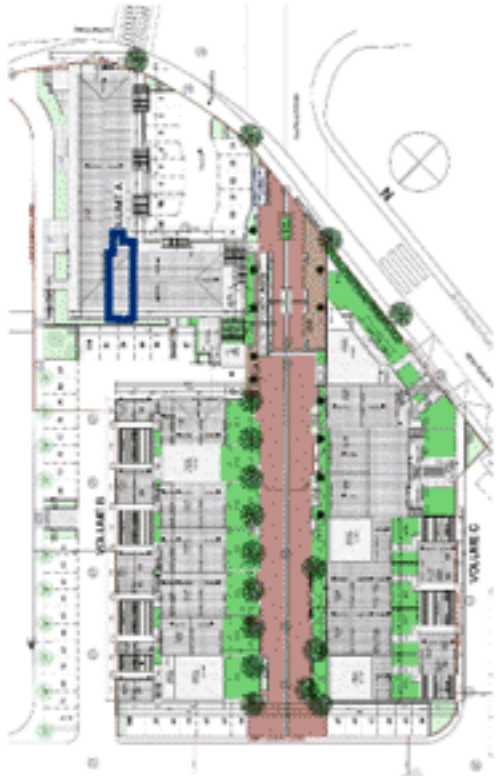
Positionnement sur plan de masse