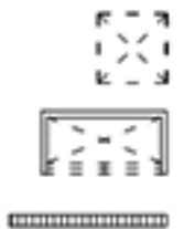
Tableau électrique Coffre de volet roulant Gaine technique Faux plafond

Elément de cuisine dessiné à titre indicatif Placard dessiné à titre indicatif Protection solaire fixe