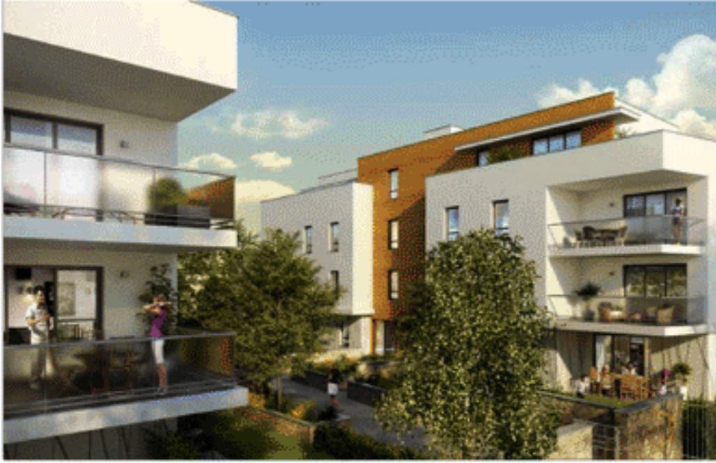
Plan de Vente