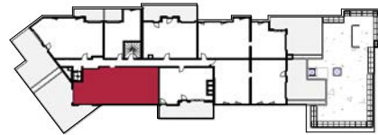
TABEAU DES SURFACES