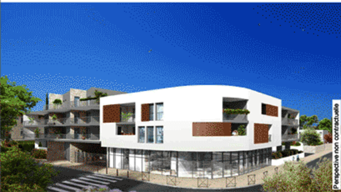
Perspective non contractuelle