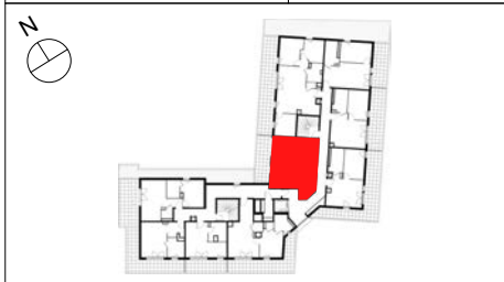
TABLEAU DE SURFACE