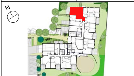
TABLEAU DE SURFACE